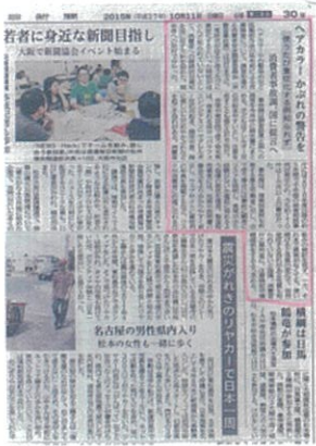
◀ヘアカラーによるアレルギー性 接触皮膚炎の警告を報告した新聞記事